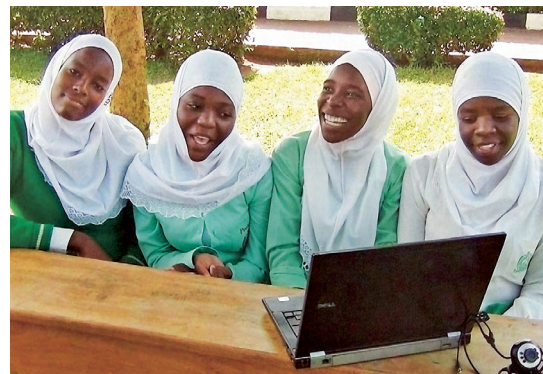
Austausch mit einer Schulklasse aus Uganda.

Auf www.energie-klimapioniere.ch können alle Klassen gegenseitig verfolgen, was andere Klassen bei der Umsetzung ihrer Projekte und Challenges erlebt haben.