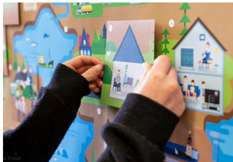
Das interaktive Poster in Aktion.